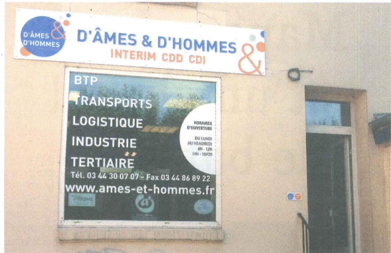
Les locaux de l'agence D'Âmes et d'Hommes en plein centre ville de Compiègne